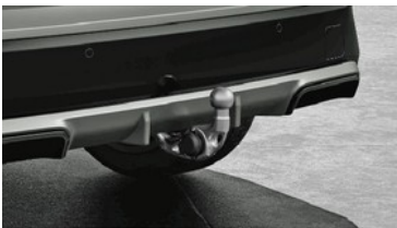
Anhängerkupplung mit schwenkbarem Kugelkopf

Die Anhängerkupplung mit elektrisch schwenkbarem Kugelkopf bedienen Sie bequem per Knopf im Gepäckraum. Die Anhängerkupplung verfügt über eine Anhänger-Stabilisierungskontrolle sowie eine diebstahlsichere Befestigung. Unter die Heckschürze geklappt, ist der Kugelkopf nahezu unsichtbar.