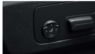
Aktivsitz für Fahrer und Beifahrer

Die Anhängerkupplung mit elektrisch schwenkbarem Kugelkopf bedienen Sie bequem per Knopf im Gepäckraum. Die Anhängerkupplung verfügt über eine Anhänger-Stabilisierungskontrolle sowie eine diebstahlsichere Befestigung. Unter die Heckschürze geklappt, ist der Kugelkopf nahezu unsichtbar.