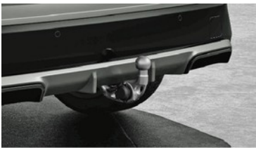
Anhängerkupplung mit schwenkbarem Kugelkopf

Die Anhängerkupplung mit elektrisch schwenkbarem Kugelkopf bedienen Sie bequem per Knopf im Gepäckraum. Die Anhängerkupplung verfügt über eine Anhänger-Stabilisierungskontrolle sowie eine diebstahlsichere Befestigung. Unter die Heckschürze geklappt, ist der Kugelkopf nahezu unsichtbar.