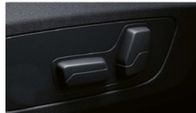
Sitzverstellung, elektrisch mit Memory

Die Anhängerkupplung mit elektrisch schwenkbarem Kugelkopf bedienen Sie bequem per Knopf im Gepäckraum. Die Anhängerkupplung verfügt über eine Anhänger-Stabilisierungskontrolle sowie eine diebstahlsichere Befestigung. Unter die Heckschürze geklappt, ist der Kugelkopf nahezu unsichtbar.