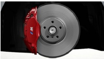
M Sportbremse, rot hochglänzend